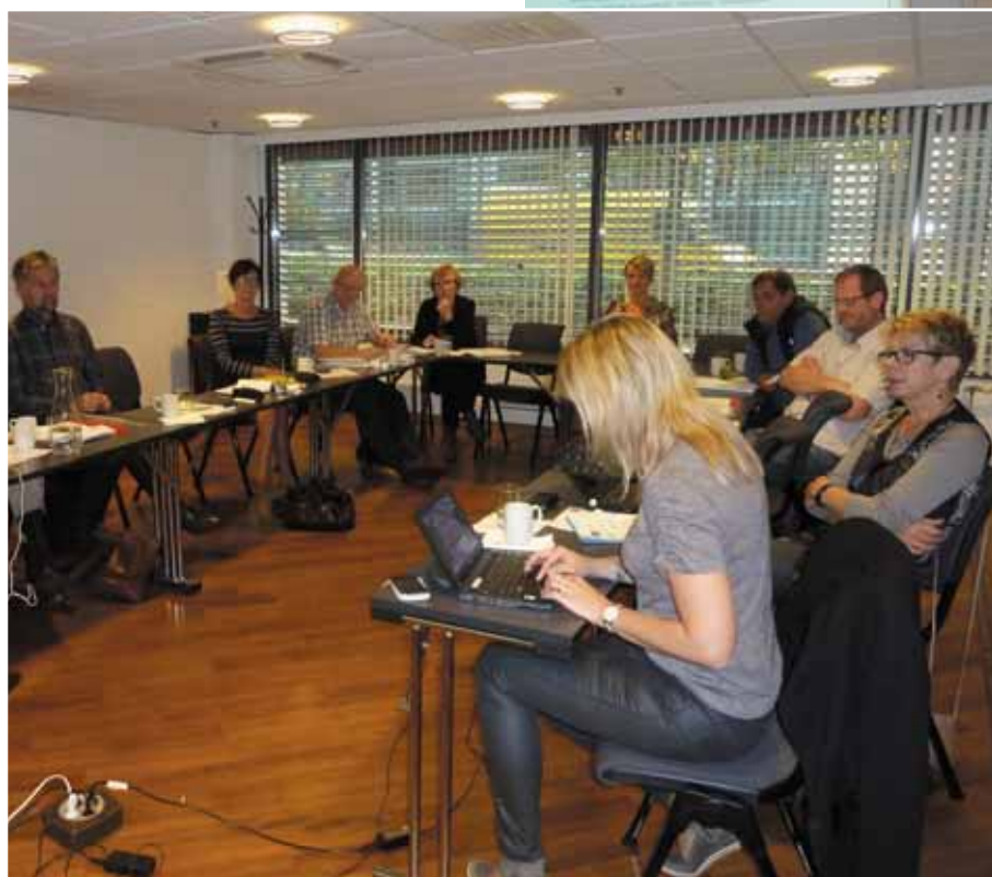
En lydhør forsamling