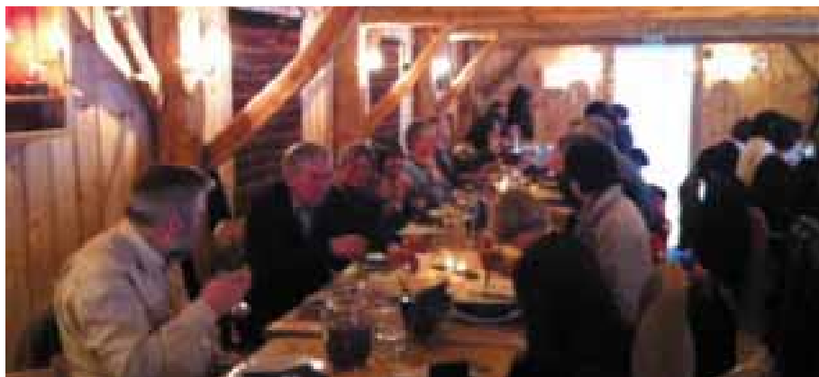
Stemming rundt bordet

praktiske eksempel for å illustrera framtidens leiarutfordringar. Han peika på at Samhandlingsreforma vil krevja eit utstrakt samarbeid mellom kommunar, med helseforetak, med frivillige samt tettare styringsdialog med fastlegar og andre avtalespesialistar. Leing kan difor ikkje berre utøvast innanfor ein tradisjonell hierarkisk styringsmodell, leiarskap må òg utøvast gjennom nettverk og partnerskap. Dette stiller svært store krav til tillit og gjensidig respekt mellom aktørar, og store krav til framtidens leiarar!